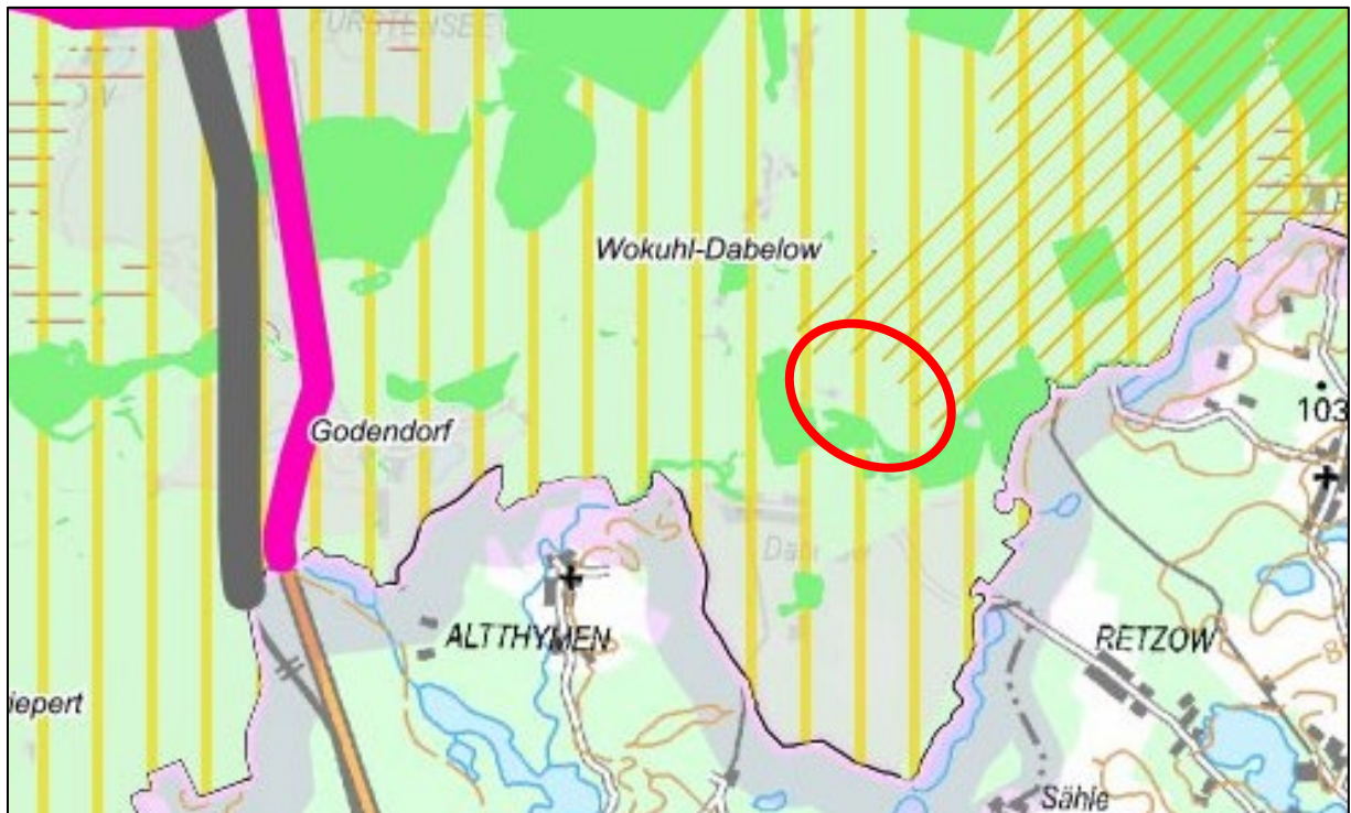
Abbildung 1: Ausschnitt aus dem LEP M-V (Lage Planungsraum rot markiert)

In der Festlegungskarte des Landesraumentwicklungsprogramm wird der Planungsraum als Vorbehaltsgebiet Tourismus dargestellt.