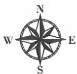
Bebauungsplan der Gemeinde Möllenbeck „Solarpark Warbende“ Ausgrenzung