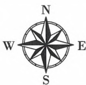
Bebauungsplan der Gemeinde Blankensee "Solarpark Watzkendorf" Ausgrenzung