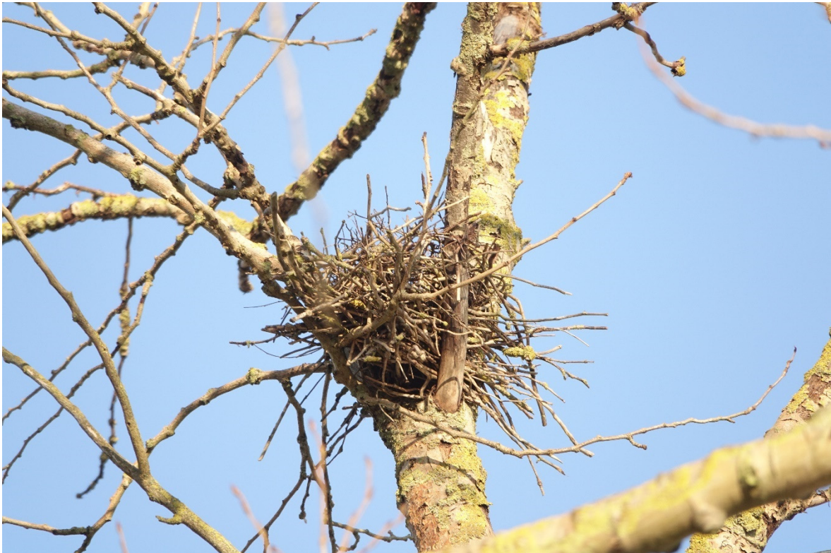
Foto 8 Nest 3 Nahaufnahme (33 U 389187 5917138)