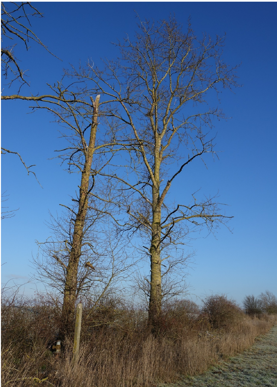
Foto 5 Nest 2 (33 U 389097 5916984)