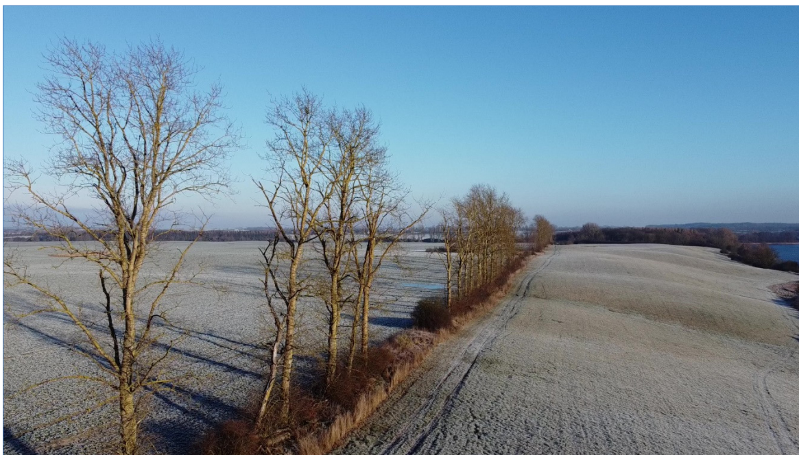
Foto 1 Pappelreihe, Blick nach Norden

In den Pappeln fehlen Strukturen wie Baumhöhlen oder Baumspalten, die von Fledermäusen als Quartier genutzt werden könnten.