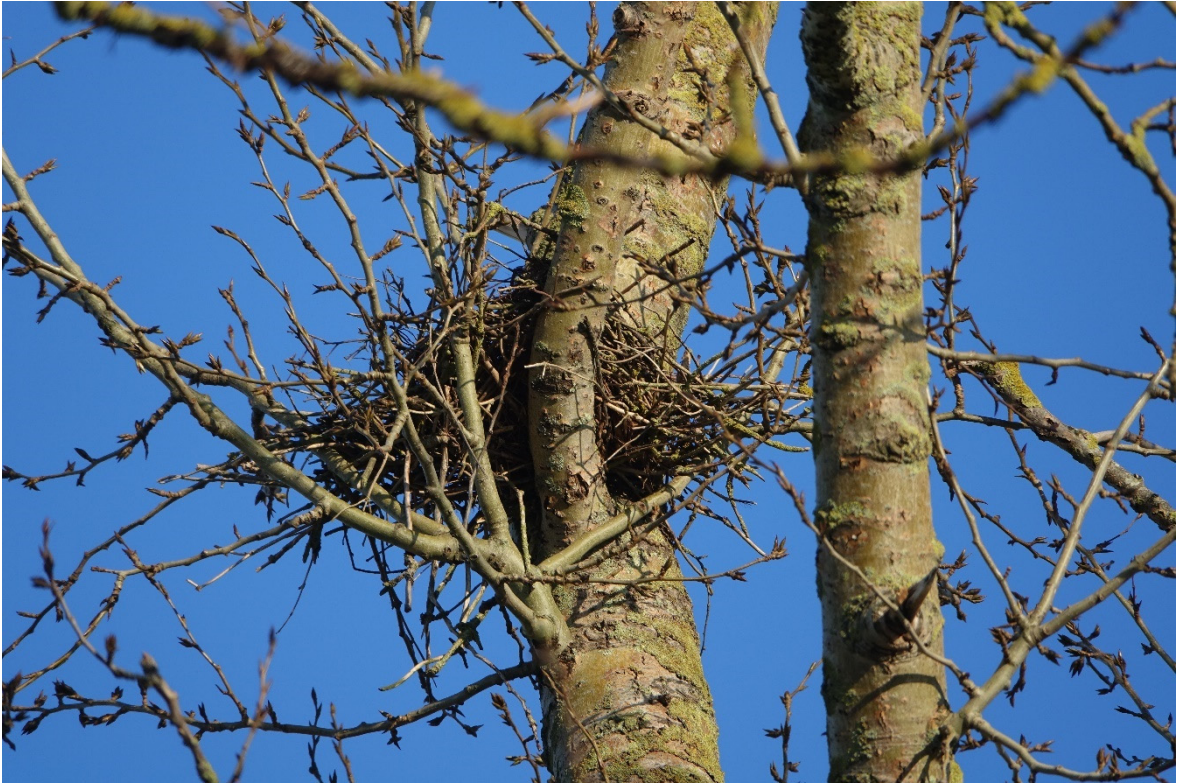
Foto 6 Nest 2 Nahaufnahme (33 U 389097 5916984)