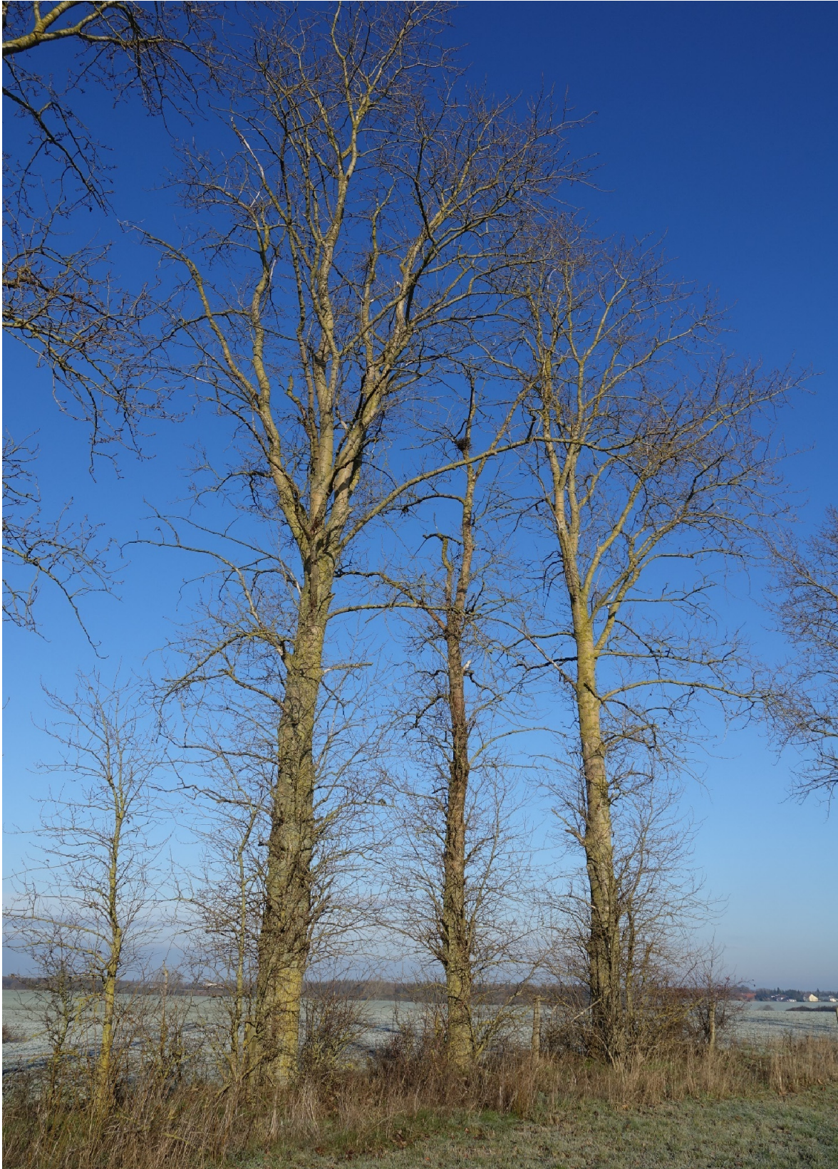
Foto 7 Nest 3 (33 U 389187 5917138)