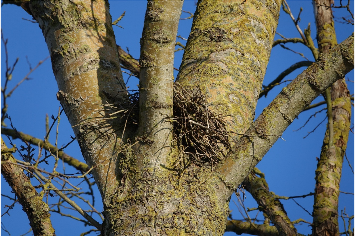
Foto 4 Nest 1 Nahaufnahme (33 U 389040 5916920)