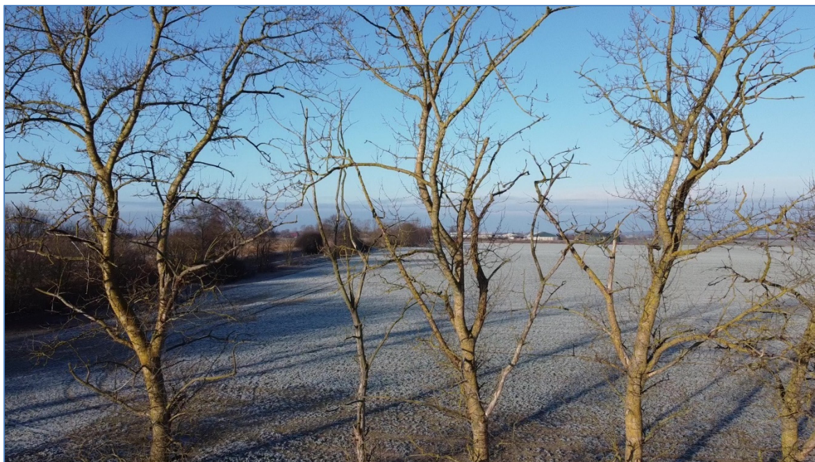
Foto 2 Pappelreihe, Blick nach Westen