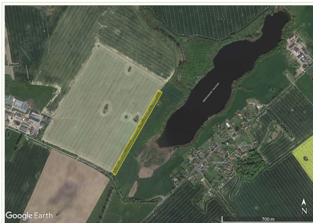
Abb. 1 Lage der untersuchten Pappelreihe (gelbe Markierung)